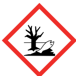
Danger pour l'environnement