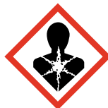
Danger pour la santé