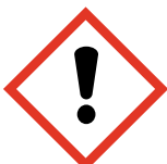
Nocif ou irritant