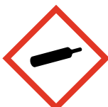
Gaz sous pression